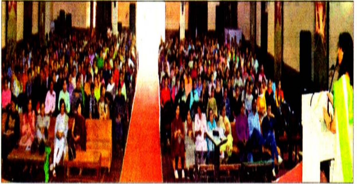
कॉलेज में करवाए गए कार्यक्रम का दृश्य।

उन्होंने कहा कि उनका लक्ष्य भारतीय शैक्षणिक मूल्यों को बढ़ावा देकर एक स्वस्थ समाज के विकास हेतु ज्ञान का प्रसार कर अकादमिक